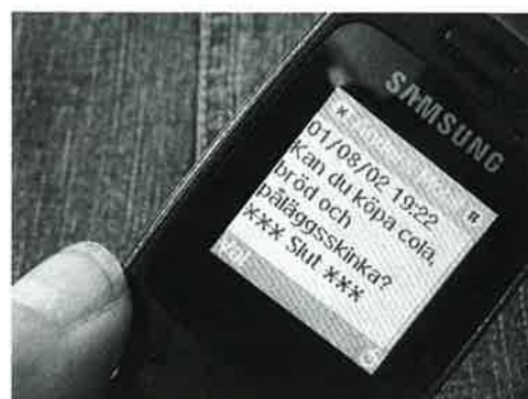
Minne av en hungrig son

Från och med den 1 december kan du som använder mobiltelefon eller annan kommunikationsutrustning på ett trafikfarligt sätt få betala böter. Exempel på trafikfarligt användande kan vara att skicka sms, titta på film eller använda sociala medier så att det påverkar körningen.